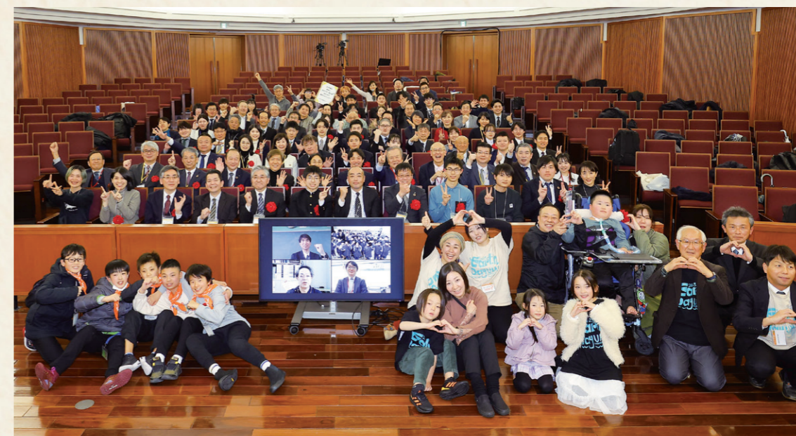
出席者による集合写真