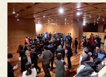
至る所で小さな談笑の輪ができました

交流会では、受賞者を中心に、実行委員、審査委員、ご協賛企業、関係者が、所属の垣根なく話し、親交を深めました。応援したい人や団体にエールシールを渡しながらか親睦を深め、今後の連携や活動の発展のヒントにつなげていました。また、書類審査(1次)を通過した奨励賞受賞者には賞状を授与しました。(受賞一覧は公式サイトに掲載)