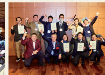
奨励賞受賞者に賞状を授与