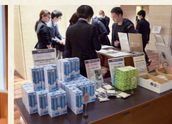
多くの企業からノベルティのご提供がありました